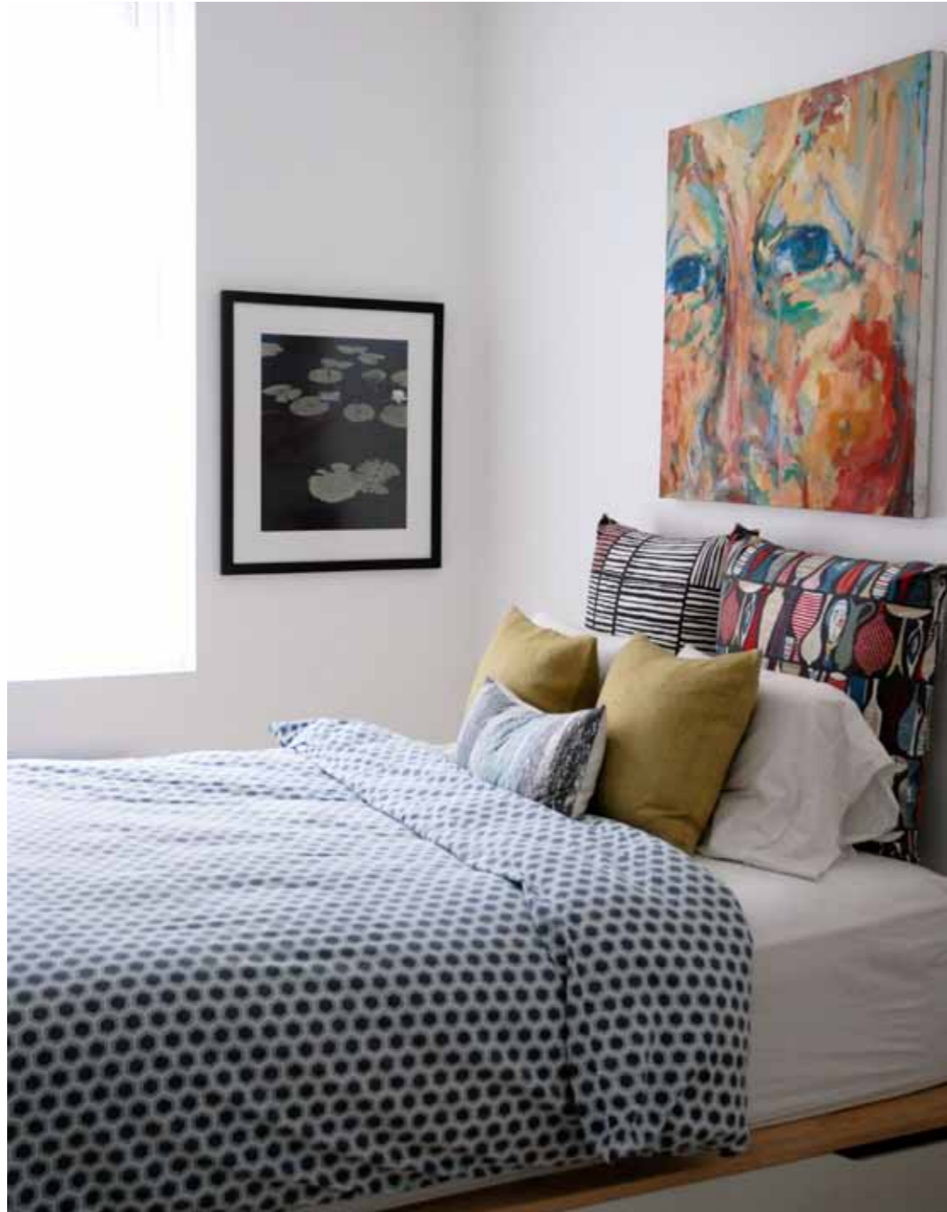
Gjesterommet ligger rett ved inngangen. Her er det vintage-lamper og møbler og "hang it all" fra Eames (Vitra).