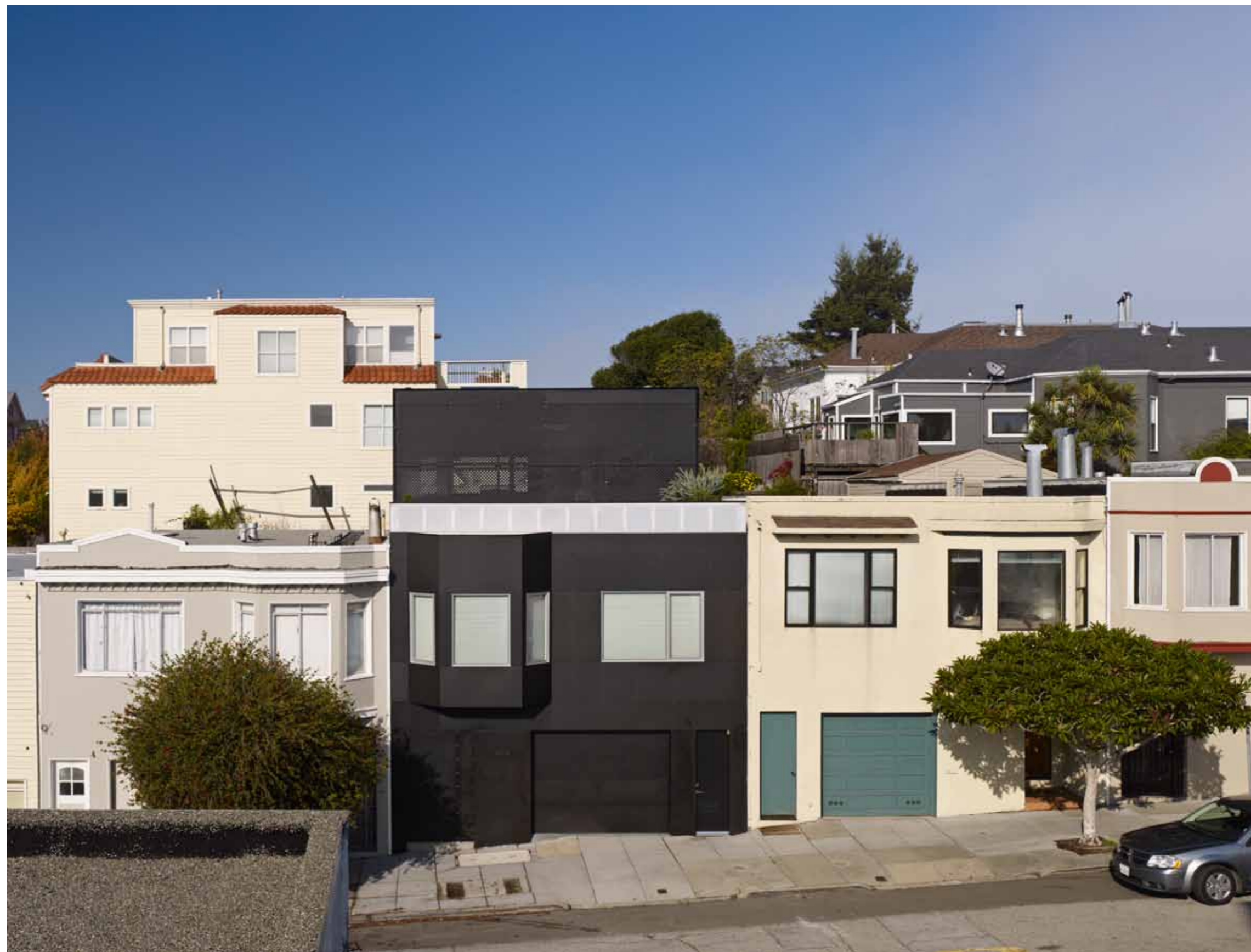
CASPER OG 20th STREET I SAN FRANCISCO