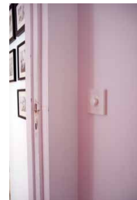
Alle dørene i leiligheten har forskjellige farger; blå til gjesterommet, gul til barnerommet, noe lilla og noe rosa. Master bedroom; hvitmalt, med Tolomeo-lampe, finerskap og smykkehylle.